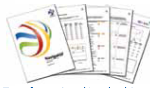
Transformational Leadership 360grader: lederkompetencer

www.insightsdanmark.dk www.insightskurser.dk info@insightsdanmark.dk